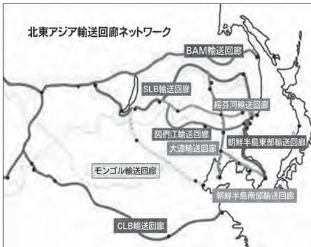
図1 北東アジア輸送回廊ビジョン